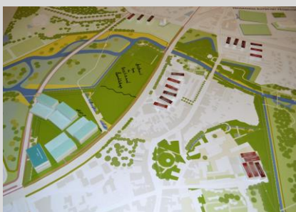
Maquette groep 4