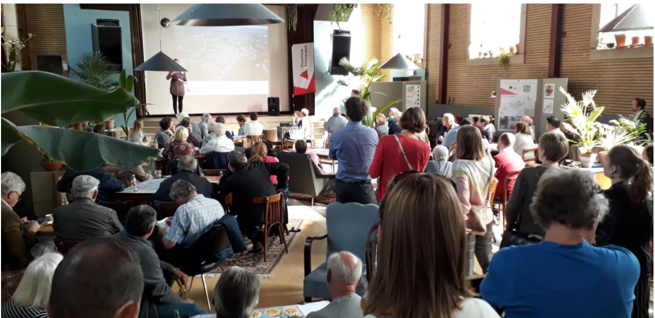
Sfeerbeeld inspraakmoment PRUP Olympiadelaan, 29 september 2018