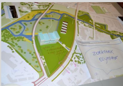
Maquette groep 1