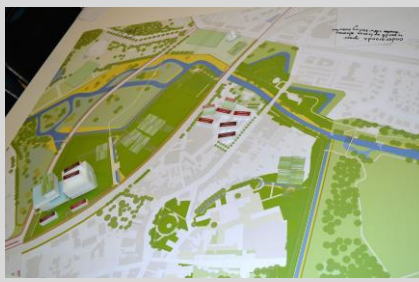
Maquette groep 2