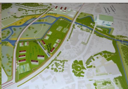
Maquette groep 5