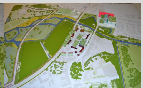
Maquette groep 6