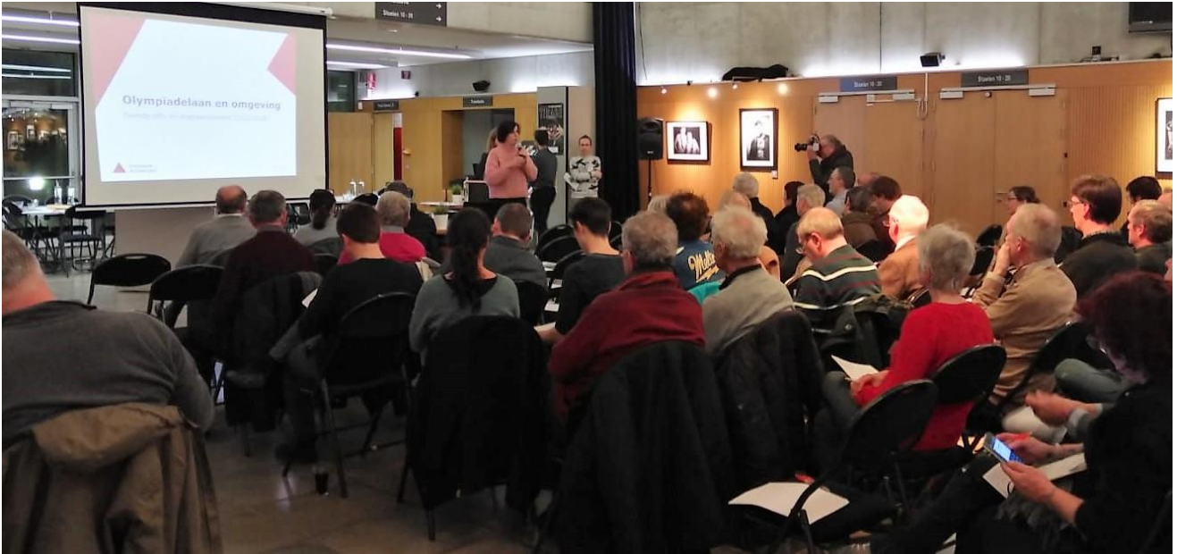
Sfeerbeeld inspraakmoment PRUP Olympiadelaan, 12 december 2018