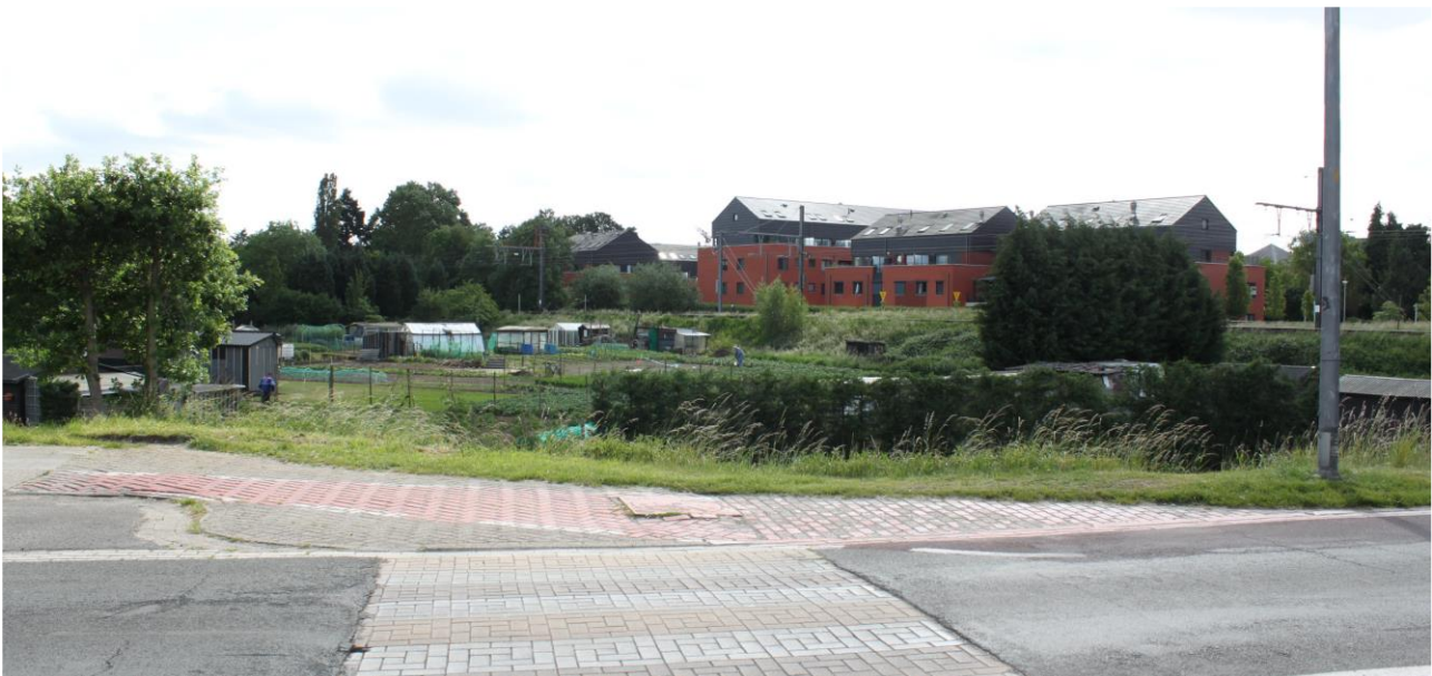
Zicht vanaf Olympiadelaan ter hoogte van het station, Herentals

Daarom maakt de provincie een provinciaal ruimtelijk uitvoeringsplan (PRUP) op, dat vastlegt waarvoor je een omgevingsvergunning kan krijgen. Dit is een planproces dat enkele jaren duurt. De provincie geeft daarbij inspraakansen aan de omwonenden en andere inwoners van Herentals, aan de eigenaars en aan de gebruikers van dit gebied.