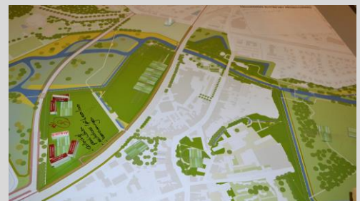
Maquette groep 3