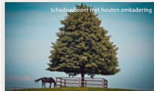
Schaduwboom met houten omkadering

-Door schaduwbomen, knotbomen, houtkanten en heggen te integreren zorg je voor beschutting tegen zon, regen en wind, geef je structuur aan het landschap en bezorg je andere faunasoorten voedsel- en schuilmogelijkheden.