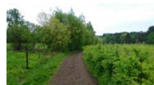
Meidoornhaag rond weide