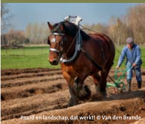
Paard en landschap, dat werkt!

De toename van het aantal paardenhouders biedt heel wat kansen voor biodiversiteit, ecologisch herstel en vrijwaring van waardevolle landschappen. Door streekeigen kleine landschapselementen te integreren, paardenweides als kruidenrijke graslanden te beheren en landschapsvriendelijke materialen te gebruiken, bent u naast paardenhouder, ook landschapsbouwer!