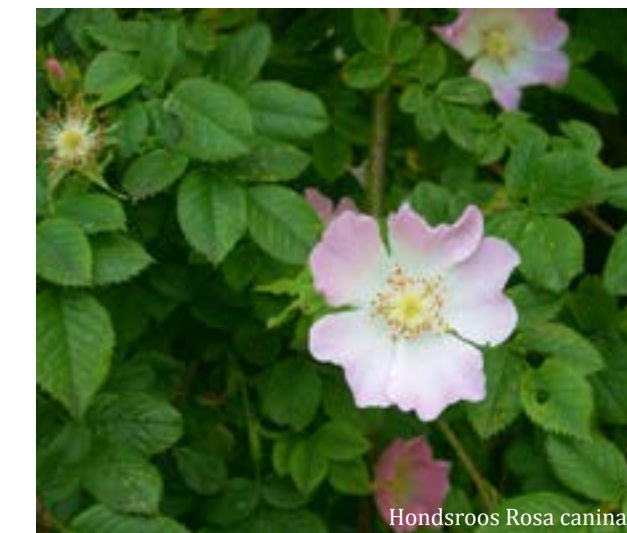
Hondsroos Rosa canina