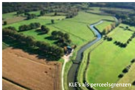
KLE's als perceelsgrenzen

In de provincie Antwerpen vind je verschillende streken. Bij elke streek hoort een landschapstype. Zo bestaat onze provincie uit boscomplexen, valleigebeden, open-, halfopen- en gesloten landschappen. Elk van deze landschapstypes is opgebouwd uit specifieke kleine landschapselementen (KLE's) zoals autochtone bomen, houtkanten, heggen, poelen, weiden en graslanden. Vroeger werden deze elementen gebruikt als perceelscheidingen, bron van gerief- of brandhout, oriëntatiepunten, veekering, extra schaduw en watervoorziening, maar ook vandaag bewijzen zij hun nut.