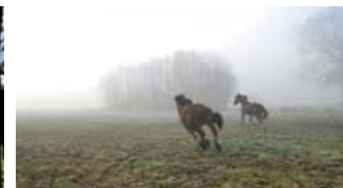
Ruimte om te bewegen