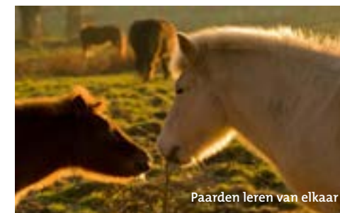
Paarden leren van elkaar

Paarden zijn kuddedieren die nood hebben aan gezelschap, beweging, voedsel en water . De weide is dé plaats bij uitstek waar paarden zich "thuis" voelen. Het is de natuurlijk biotoop van het gedomesticeerde paard. Paarden geven zelfs de voorkeur aan de relatieve vrijheid op de weide boven, het op het eerste zicht, hogere comfort in een stal of schuilhok.