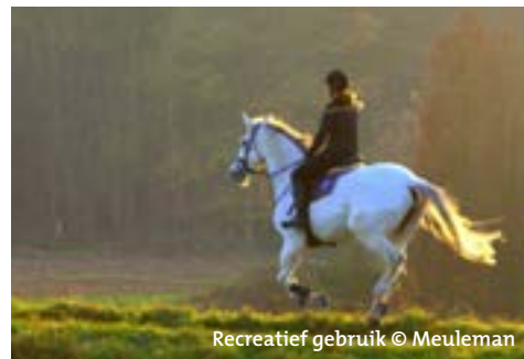
Recreatief gebruik

zijn dan ook duidelijk merkbaar. Er is een enorme toename van versnipperde percelen en het opduiken van schuilhokken, rijpistes, ruitersporen, maneges, jumpingconstructies, lichtbakken en afrasteringen. Het veranderd landgebruik en het beheer van graasweiden heeft bovendien een niet te onderschatten impact op het landschap, de biodiversiteit, de waterhuishouding en de groenstructuren van onze provincie. Het is dan ook cruciaal deze landschappelijke transformatie op een verantwoorde manier in te passen binnen onze steeds schaarser wordende open ruimte.