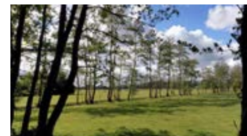
Dunne elzensingel rond weide