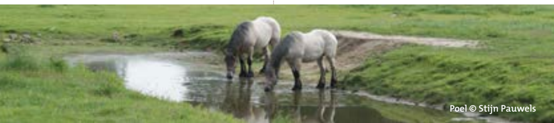
Poel © Stijn Pauwels