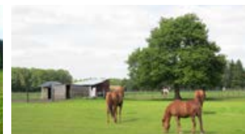
Schaduwboom in paardenweide